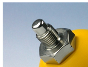
1/4" BSP Gewinde Für kleinere Querschnitte

Der flow-captor 412x.1x ist in verschiedenen Sensorkopf-Ausführungen erhältlich.