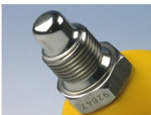
1/2" BSP Gewinde Die Standard-Version